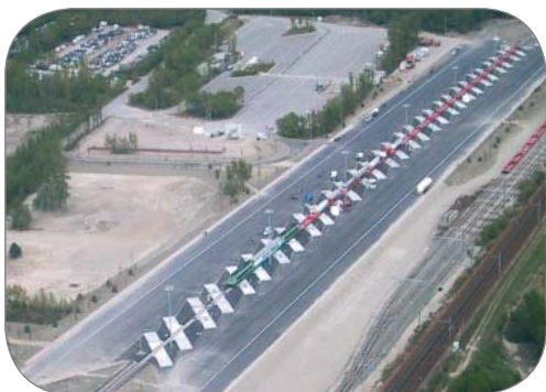
Vue aérienne du terminal d'Aiton