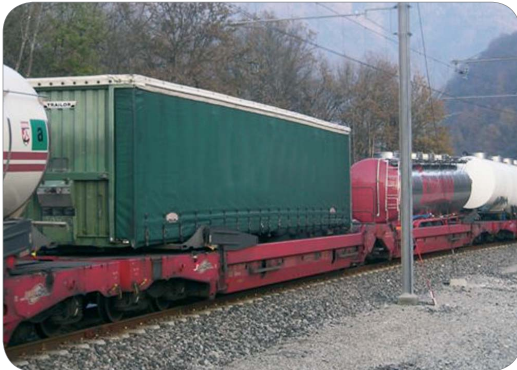
Exemple de semi-remorque bâchée abaissée utilisant l'Autoroute Ferroviaire Alpine

Devant la même offre, pour une période bien plus large (jusqu'en 2012 au moins), les transporteurs trouveront encore plus de motivation à modifier leurs équipements pour utiliser ce nouveau service très complémentaire à la route sur l'axe atlantique.