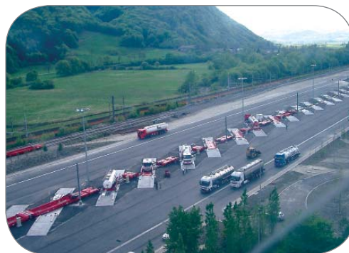
Principe de chargement en épis

La mise en place d'un tel service de ferroutage Modalohr sur l'axe Atlantique, à court terme, ne nécessite donc que :