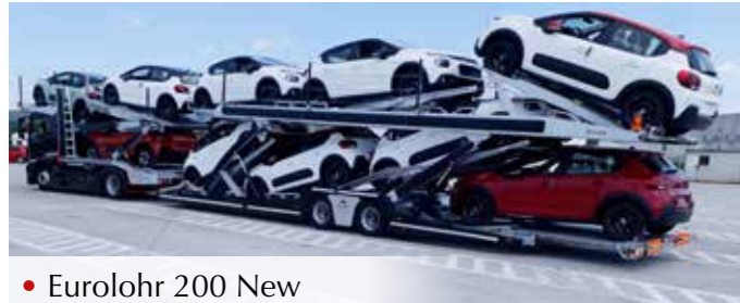
• Eurolohr 200 New