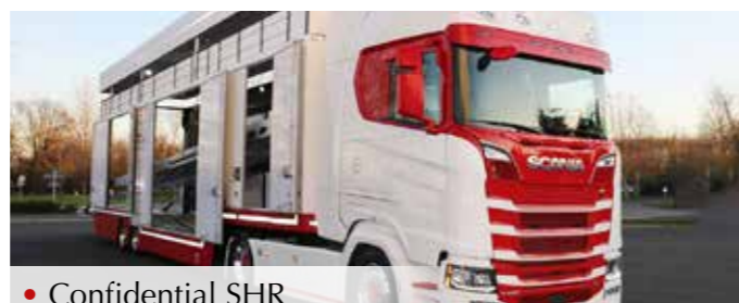
• Confidential SHR