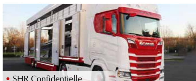
• SHR Confidentialle