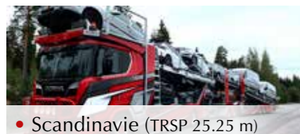
• Scandinavie (TRSP 25.25 m)