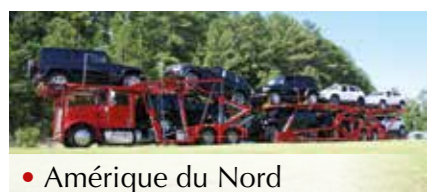
• Amérique du Nord