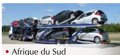
• Afrique du Sud