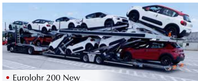
• Eurolohr 200 New