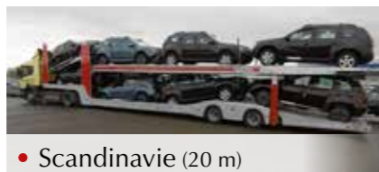
• Scandinavie (20 m)