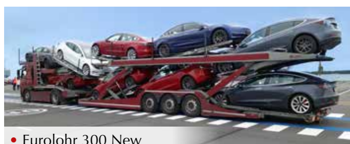
• Eurolohr 300 New